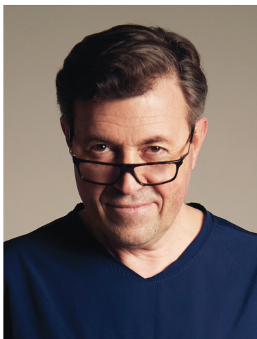
Президент Фестиваля Эндоскопии и Хирургии проф. Ю.Г. СТАРКОВ